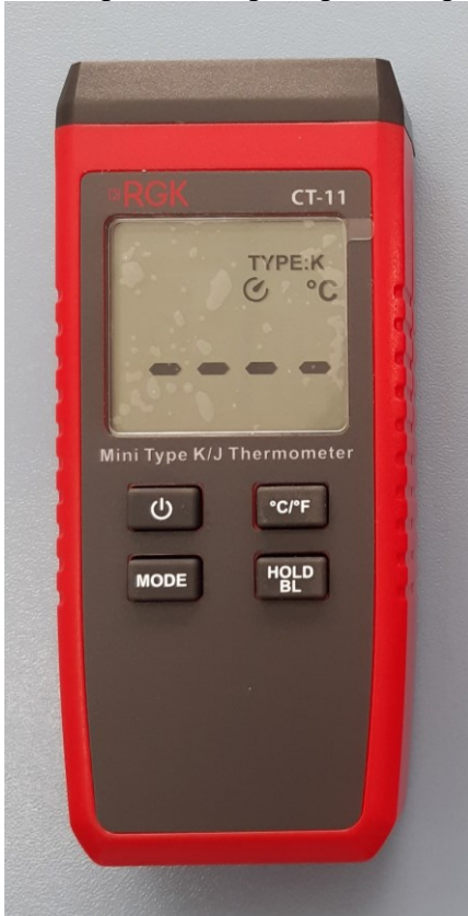
Рисунок 1 – Общий вид термометров модели CT-11

Пломбирование приборов не предусмотрено.