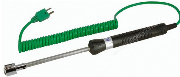
Рисунок 6 - Общий вид зонда модели TR-10S