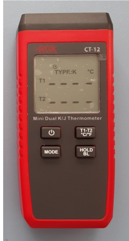
Рисунок 2 – Общий вид термометров модели CT-12