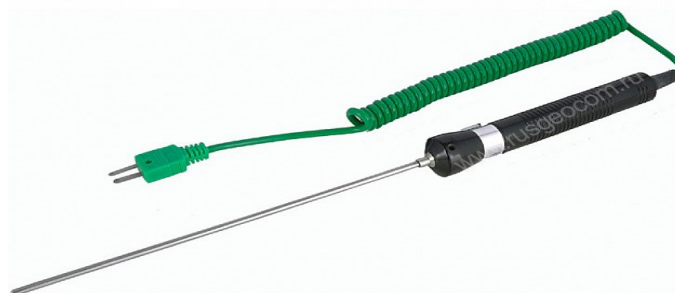
Рисунок 4 – Общий вид зонда модели TR-10W