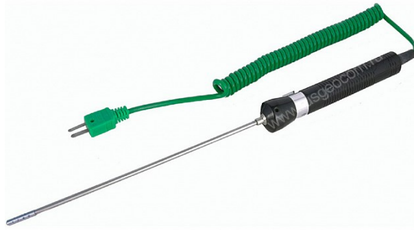
Рисунок 5 - Общий вид зонда модели TR-10А