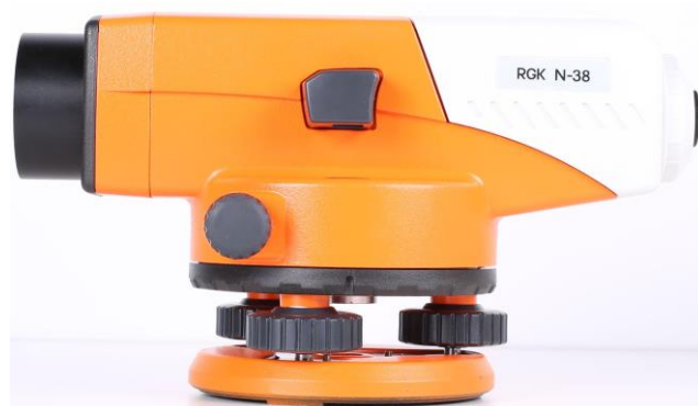
б) модель RGK N-38