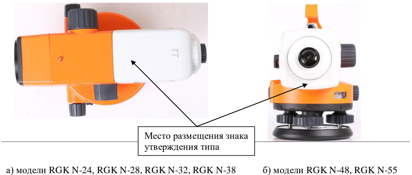
Рисунок 3 – Места нанесения знака утверждения типа