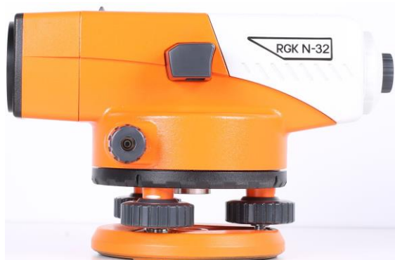
а) модели RGK N-24, RGK N-28, RGK N-32

Общий вид нивелиров с указанием места нанесения знака утверждения типа приведен на рисунках 1 - 3.